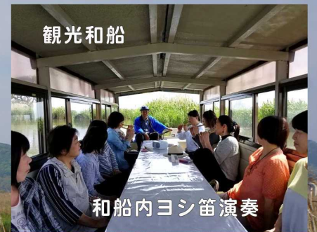
和船内ヨシ笛演奏