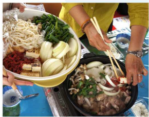
郷土料理じゅんじゅん

事前予約やキャンセルは3日前までをお願いします ホールの使用料等は事前にお問合せください