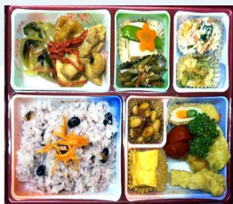
じゅんじゅん弁当

びわ湖内湖37ヶ所で唯一残った西の湖、びわ湖全体のヨシの70%相当が群生し、甲子園球場の約74倍の広さがあり、魚・鳥たちの楽園保護区です。天気でも、風が強くて乗船出来ない場合は安土城跡をお薦めします。雨が降りだしたら安土城考古博物館・信長の館 (月曜定休日) をお薦めします。いずれもボランティアガイドがつけられます。