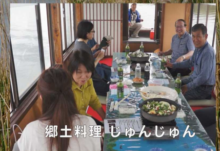
郷土料理 じゅんじゅん